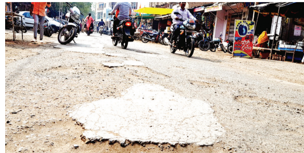
हरिभूमि न्यूज | राजगढ़

राजगढ़ नगर के मेन मार्केट में रानी लक्ष्मी चौराहे से बिरसा मुंडा चौराहे तक की सड़क पर डामरीकरण के साथ ही चौड़ीकरण कार्य होना है। करीब 39 लाख रुपए से होने वाले इस कार्य के संबंध में नगर पालिका ने टेकेदार को पांच महीने पहले वर्कआर्डर जारी कर दिया था। वर्कआर्डर जारी किए लंबा समय बीत जाने के बाद भी टेकेदार ने उक्त काम शुरू नहीं किया है। सड़क न बन पाने के कारण नगर के सैकड़ों वाहन चालकों समेत आम नागरिकों को खस्ताहाल सड़क के कारण खासी परेशानियां उठानी पड़ रही हैं। इस सड़क पर अनेकों जगह पर बड़े-बड़े गड्ढे हो चुके हैं, जिनके कारण दोपहिया वाहन चालकों को दिक्कतों का सामना करना पड़ रहा है। चूंकि, यह राजगढ़ नगर का मुख्य मार्ग है, ऐसे में हजारों लोग