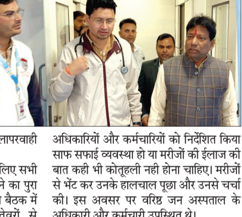
अधिकारियों और कर्मचारियों को निर्देशित किया साफ सफाई व्यवस्था हो या मरीजों की इलाज की बात कही भी की तोहली नही होना चाहिए। मरीजों से भेंट कर उनके हालचाल पूछा और उनसे चर्चा की। इस अवसर पर वरिष्ठ जन अस्पताल के अधिकारी और कर्मचारी उपस्थित थे।

हरिभूमि न्यूज ►► आष्टा शासकीय अस्पताल में रोगी कल्याण समिति की बैठक में आष्टा विधानसभा क्षेत्र के विधायक गोपाल सिंह इंजीनियर ने पहुंचकर अस्पताल का निरीक्षण कर मरीजों से भेंट की एक एमएम अस्पताल में मशीनरी और अधिकारियों कर्मचारियों को कड़े निर्देश दिए की लापरवाही कताई बर्दाश्त नहीं होगी। वहीं अस्पताल में रोगियों इलाज के लिए सभी प्रकार की सुविधाओं की व्यवस्था करने का पुरा प्रयास करेगा। रोगी कल्याण समिति की बैठक में पधार विधायक ने अपने तीखे तैवरों से