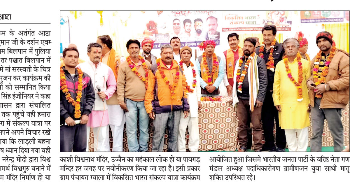
काशी विश्वनाथ मंदिर, उज्जैन का महकाल लोक हो या पावगड़ मंदिर हर जगह पर नवीनीकरण किया जा रहा है। इसी प्रकार ग्राम पंचायत ग्वाला में विकसित भारत संकल्प यात्रा कार्यक्रम आयोजित हुआ जिसमें भारतीय जनता पार्टी के वरिष्ठ नेता गण मंडल अध्यक्ष पदाधिकारी गणमीनजन युवा साथी मातृ शक्ति उपस्थित रहे।