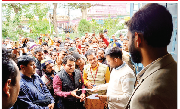
हरिभूमि न्यूज ►► आष्टा