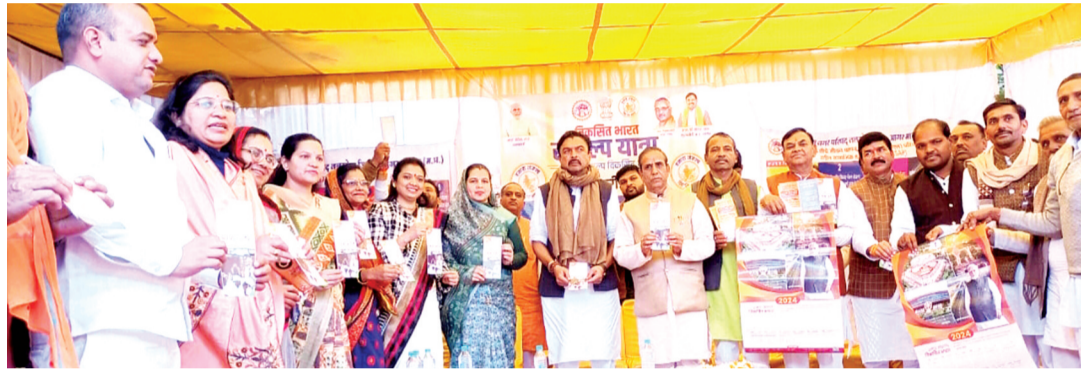
हरिभूमि न्यूज | नलखेड़ा

विकसित भारत संकल्प यात्रा का सोमवार को नलखेड़ा आगमन हुआ। जहां शासकीय उच्चतर माध्यमिक विद्यालय नलखेड़ा में शिविर आयोजित हुआ। यात्रा में उपस्थित जनप्रतिनिधियों ने संबोधित करते हुए कहा कि केंद्र सरकार ने समाज के हर वर्ग का ध्यान रखते हुए अनेकों योजनाएं बनाई हैं, जिसका लाभ सभी को मिल रहा है। भारत संकल्प यात्रा के