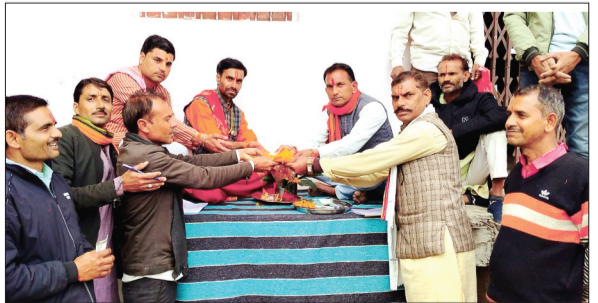
हरिभूमि न्यूज ►► रयामपुर

ग्राम घाटपलासी में अयोध्या से आए अक्षत चावल का निमंत्रण कि शुरुआत डी जे के साथ शुरू हुआ। अयोध्या मन्दिर का शुभारंभ 22 जनवरी को होने पर पूरे गांव में घर-घर जाकर अयोध्या के अक्षत चावल से निमंत्रण दिया जा रहा है। गांव के यूवाओं ने अपनी-अपनी बाईक में भावा झंडा लगा कर डीजे के पीछे चल रहे थे। डी जे पर श्री राम के उद्घोष के साथ अयोध्या मन्दिर के भजनों कि शाय पर कार्यकर्ताओं ने जुलूस निकाल कर घर-घर कलश पूजन पंडित के द्वारा कराया जा रहा है। इसी के साथ चंदा किया जा रहा है जिससे मन्दिर पर 22 जनवरी को भंडारे का आयोजन होना है। इस