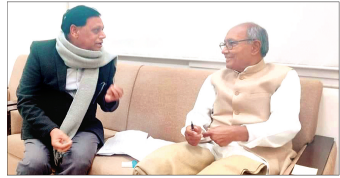
हरिभूमि न्यूज ►► आष्टा